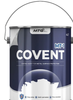
COVENT MT-1 (저점도)