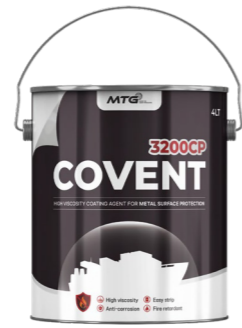
COVENT 3200CP (고점도)